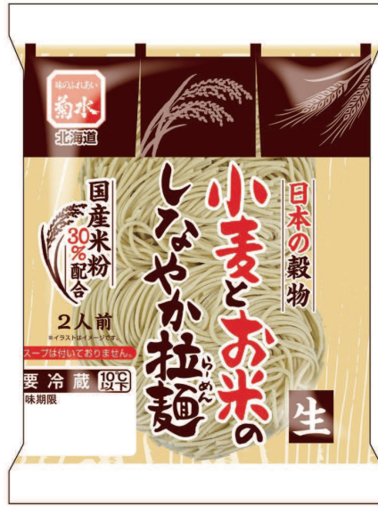
小麦とお米のしなやか拉麺 2人前