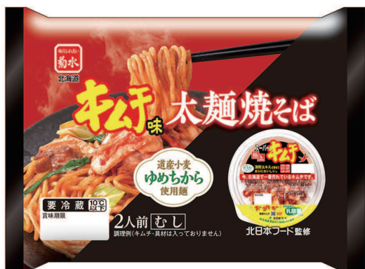
【キムチ味太麺焼そば 2人前】