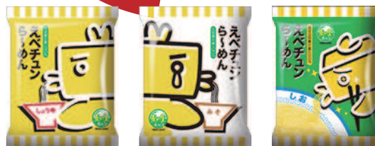
〈えべちゅんら〜めん1人前各種〉